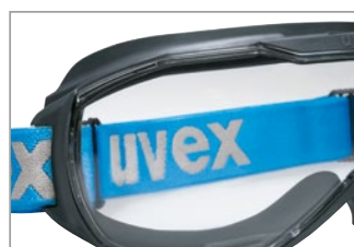
レンズ交換が簡単な独自のフレームレスレンズデザイン