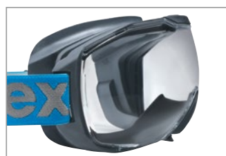
優れた視界を確保する革新的なゴーグル

広い内部空間と特別設計されたフレームのスペースにより、めがねを装着したままでも使用できるユニバーサルフィットデザインで、着用者全員に同じレベルの保護を提供します。スポーティで人間工学に基づいたデザインと非常に快適なフィット感が特長の信頼性の高い装備で、一日中、集中力を損なうことなく過ごせます。