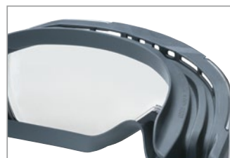
ソフトな素材がどんな顔立ちにも密着