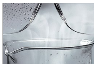
uvex の実績ある supravision コーティングテクノロジー