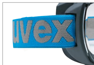
簡単に交換可能なヘッドバンド (幅 30 mm)