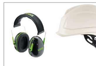
他の uvex 保護具と併用可能