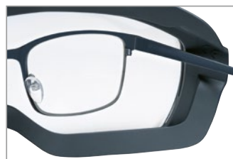
フレームに temple 用のスペースを設けて OTG に対応