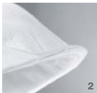
Les bords souples permettent d'éviter les zones de pression.