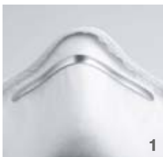
Le clip nasal réglable assure un ajustement individuel et une étanchéité maximale.