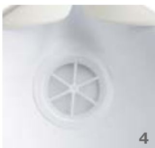
La soupape ouvrable à 360° assure une moindre résistance à l'expiration et un climat agréable à l'intérieur du masque.