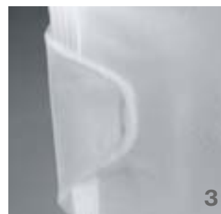
Le bandeau de serrage intégral peut être adapté aux habitudes de port spécifiques.