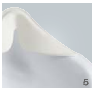
Le joint d'étanchéité assure à la fois une meilleure étanchéité et un plus grand confort de port.