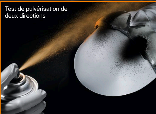
Test de pulvérisation de deux directions

Adaptation ergonomique au niveau du visage : la distance entre les lunettes et le front a été mesurée à quatre points différents – là encore, les lunettes uvex pheos cx2 font la différence.