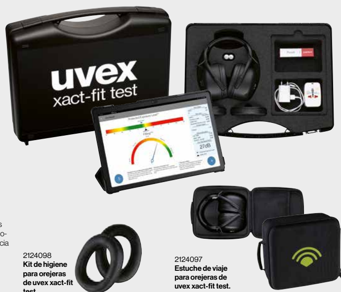
2124098 Kit de higiene para orejeras de uvex xact-fit test.