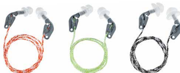
2124019 uvex xact-fit multi Size S

Para garantizar que los tapones de protección auditiva ofrezcan una protección efectiva y sean aceptados por los usuarios, se deben tener en cuenta varios factores, como el tiempo de uso, los niveles de ruido y la compatibilidad.