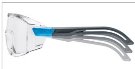
Patillas ajustables en tres niveles para un ajuste excepcional