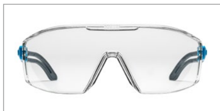
Diseño de lente plana con un campo de visión ilimitado

La probada tecnología de recubrimiento uvex supravision garantiza una visibilidad óptima durante el trabajo, lo que convierte a la uvex i-lite en la compañera ideal para la vida laboral diaria.