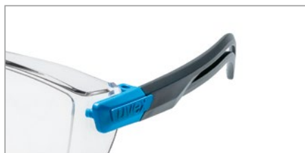
Patillas con forma ergonómica para un ajuste perfecto y una sujeción segura sin crear puntos de presión