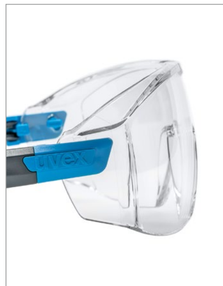
x-tended sideshield ofrece una protección lateral adicional