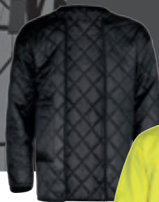
Veste intérieure pour N° d'article : 88468