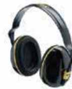
uvex K 200